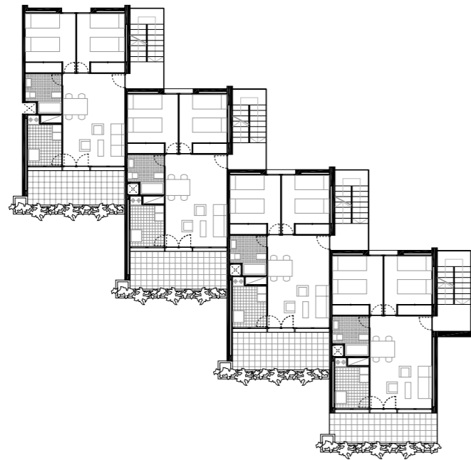
planta tipo ⊗

josep puig torné, apartaments parís , salou, 1965